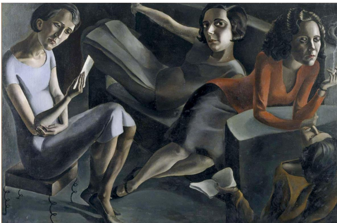
Ángeles Santos, La Tertulia . 1929.