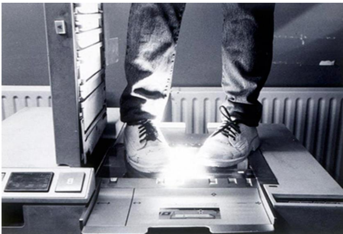
Photo_Copy_Rock'n_Roll. Jürgen O. Olbric