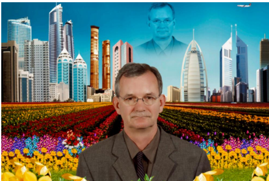
Autoportrait, Dubai, United Arab Emirate, 2007.