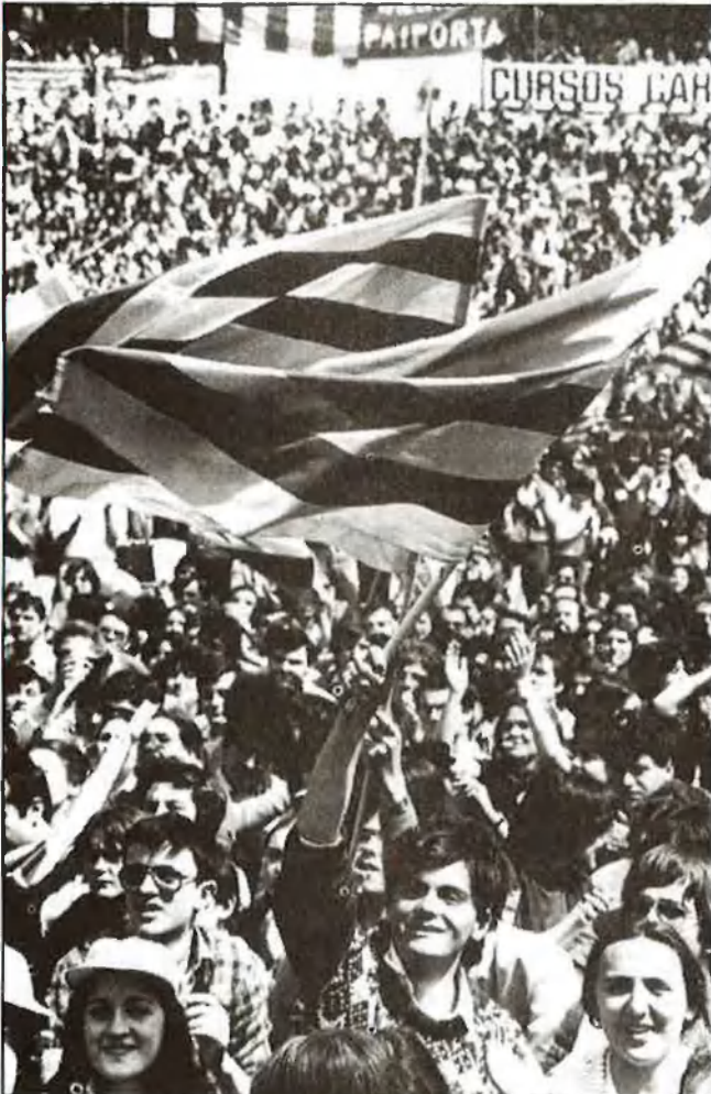
La senyera del passat, la senyera del futur

I afegien en la nota en la qual feien saber als seus lectors la iniciativa presa: «creiem que atendre la nostra proposta perquè si que hi figure seria una decisió de justícia equilibra-