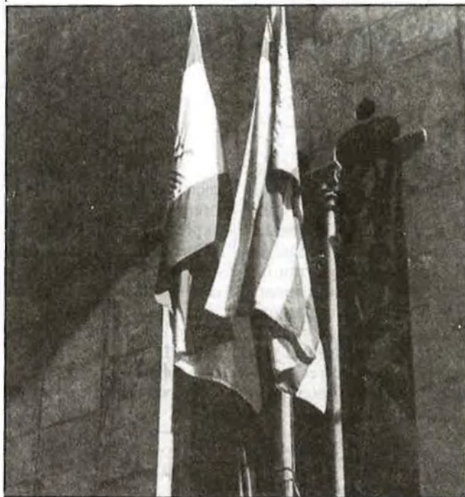
La bandera d'Espanya i la bandera de la «Comunidad», al Palau de la Generalitat

Foren el programa de ràdio «De dalt a baix» i el col·lectiu del Martíim d'UPV-València els primers que secundaren la proposta. A hores d'ara, però, des d'Acció Cultural