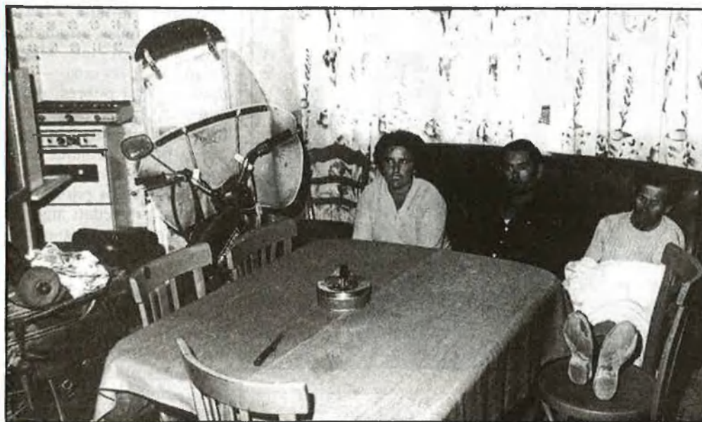
Tots, i tot, en cinquanta metres quadrats