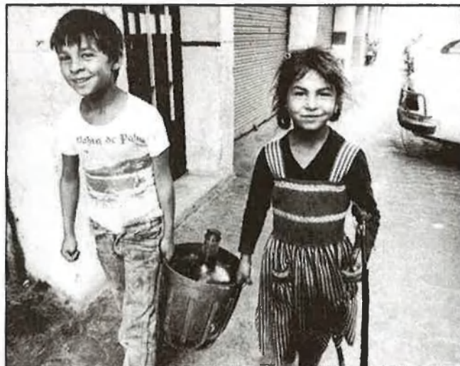
L'aigua ve de la font. Com fa mil anys

Totes les cases, o la gran majoria, tenen unes condi-