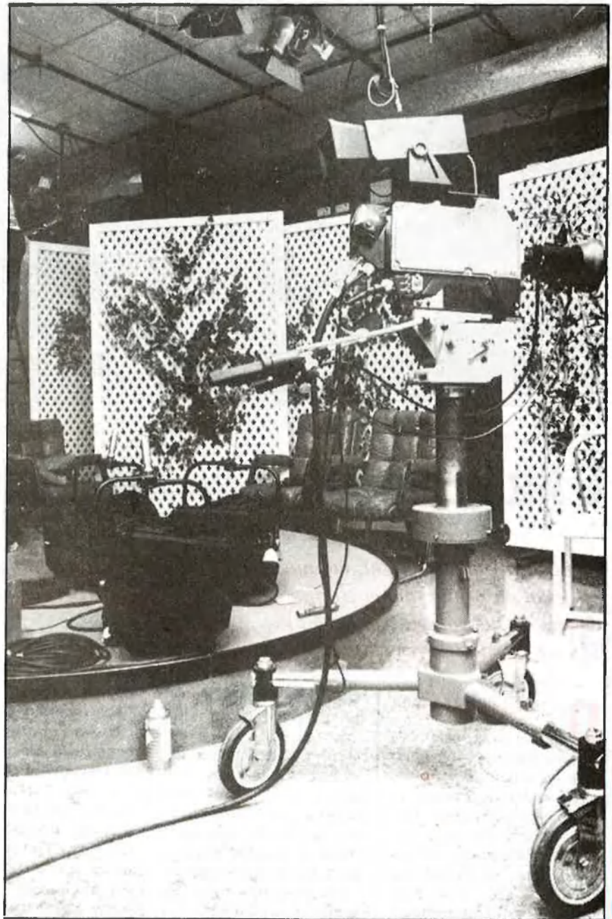
Les actuals instal·lacions costen un lloguer diari de 9.000 pessetes

El rumor que Madrid rebaixarà l'any que ve els pressupostos del Centre Regional pareix ser una reali-