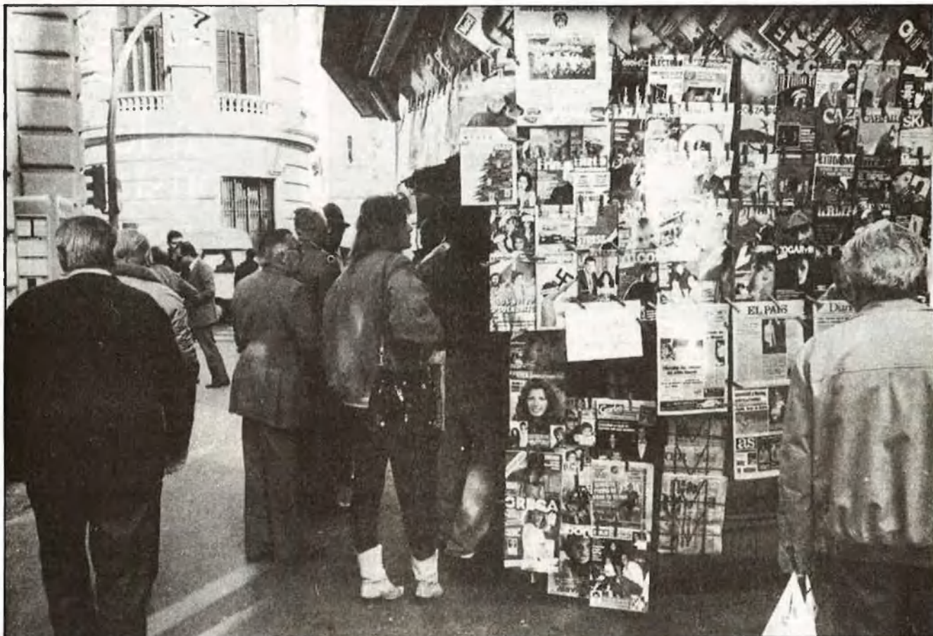
Estructura editorialística actual: un niu de problemes per al català