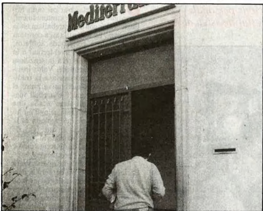
La presència del català a «Mediterráneo» és cada dia més notable

La mateixa Generalitat valenciana reconeix que «les publicacions privades que, amb més entusiasme que expectatives comercials, han tractat de mantenir un grau acceptable d'informació local i crear un instrument d'expressió d'aquelles veus que no