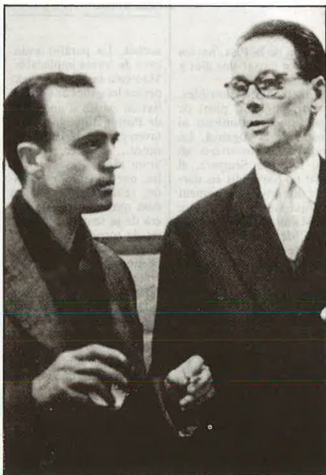
Sempere i Vasarely

serable arreglant bombetes mig fuses o fabricant joguines de casa, quan no dibuixant etiquetes per a un sastre qualsevol. Tot això podia ser immolat a la falla del foc redemptor de l'art. El que no podia suportar era com, un cop havia obert el forat, el propi país reaccionés despectiu i altaner, i que se'n rigués.