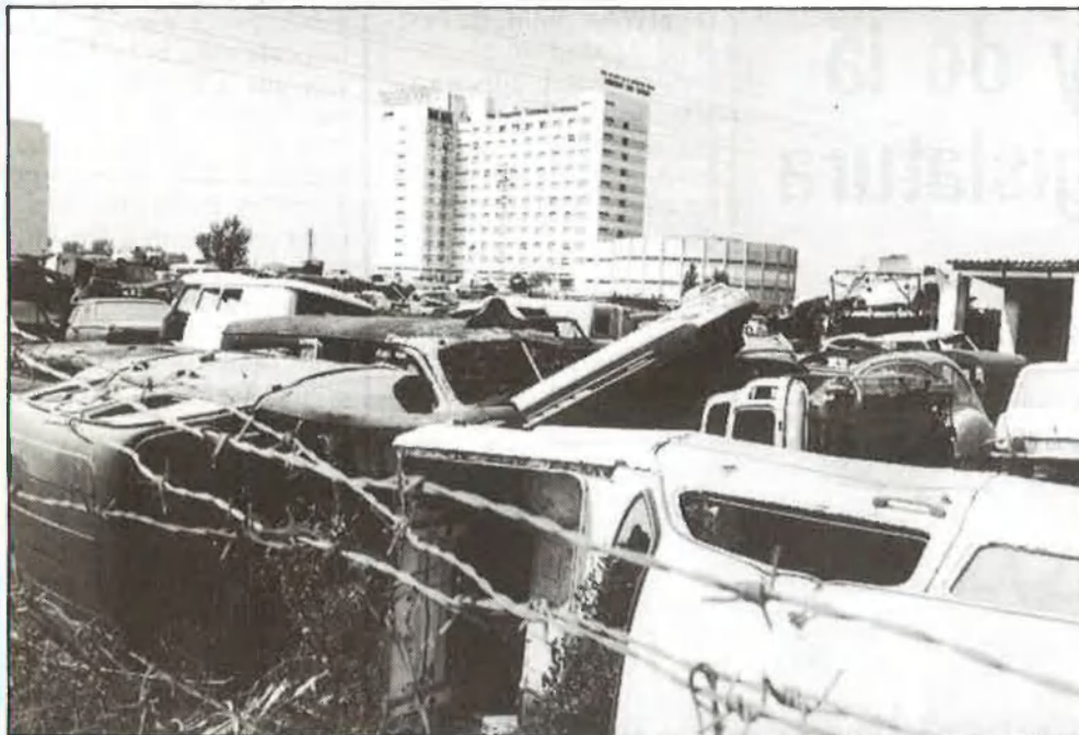
Cal reformar la Seguretat Social. Però, ¿com?