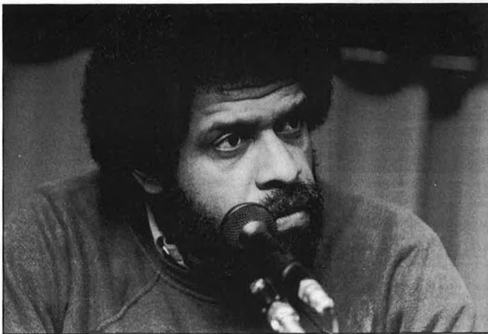
«Al nostre país s'esta eternitzant una situació colonial