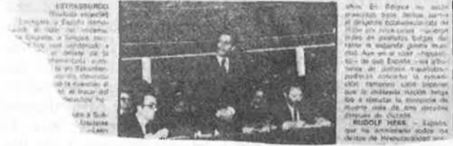
Estrasburg, 1979: Bèlgica torna a demanar-ne l'extradició.

El nazi Degrelle, exiliado de la Alemania nazi, fue el responsable de la ocupación de Bélgica por los nazis durante la Segunda Guerra Mundial. Por su participación en la guerra, fue considerado uno de los criminales de guerra más importantes de la Segunda Guerra Mundial.