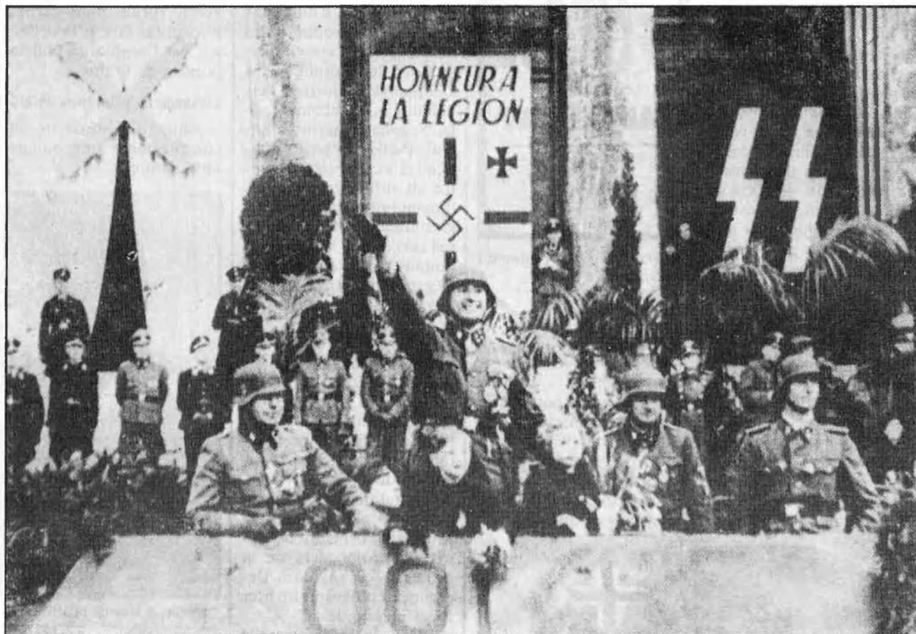
Degrelle, a la Brussel·les ocupada pels nazis, saluda a la romana, el pas dels seus legionaris sota la creu gammada