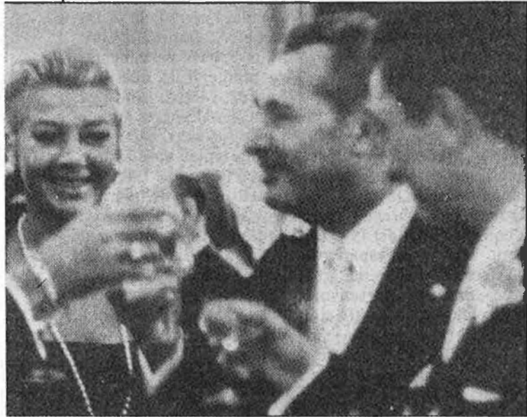
el germà de la reina de Bèlgica.

Les bombes, efectivament, hi foren llançades, i quan a final d'aquell mes els aliats alliberaren Bèlgica, es comptabilitzà els estralls de l'ocupació alemana. Entre els milers de