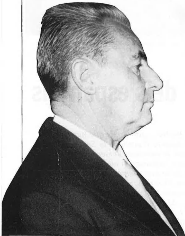
Degrelle, a Madrid, en 1969

A les acaballes de la Primera Guerra Mundial, la Bèlgica en aparença provincialiana ha esdevingut la primera potència comercial del món, gràcies a la seva vasta colònia del Congo (avui anomenat Zaire). Però el crac mundial del 1929 fa més agudes les reivindicacions socials, i la irresolta qüestió lingüística i territorial de la comunitat flamenca (que parla holandès) aguditza la inestabilitat d'aquest estat una mica artificial, en el qual predomina la comunitat valona (de parla francesa). Aquesta Bèlgica, que en realitat és la part meridional dels antics Països Baixos, i que s'havia separat d'Holanda tot just en 1830, és una suma de territoris plans, ventilatats pels vents freds de l'oceà Atlàntic, «Le plat pays qui est le mienne», que va cantar Jacques Brel.