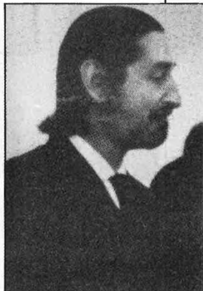
Degrelle, a Madrid, brindant amb «Fabiolo»