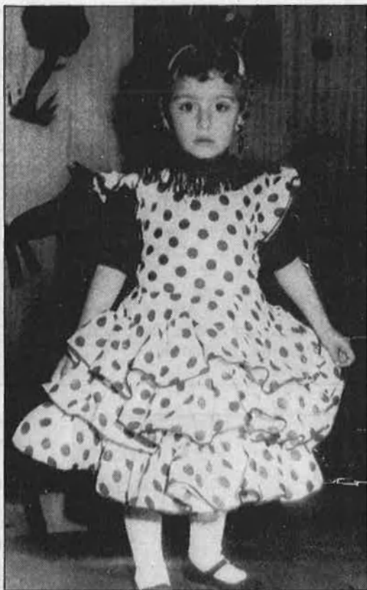
«Hauria desitjat ser fallera

Curt fou el so de les trompetes reials per a la xiqueta del carrer de Sant Vicent. Una dona per a qui l'home ideal és «madur, intel·ligent i sociable... encara que mai no es poden fixar motles sobre aquestes coses, perquè sempre canvien quan menys t'ho esperes». Que volgué ser assistent de vol d'Spantax i no ho aconseguí. Una morena maniquí