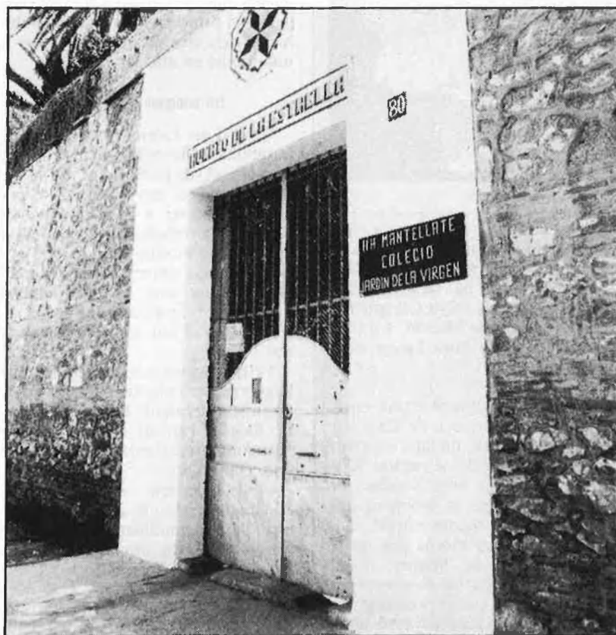
«Un col·legi de monges a Marxalenes»