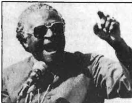
Tutu: la contraviolència negra.

El mateix dia de la posada en marxa, una dona, sospitosa de col·laborar amb la policia, de raça negra, era linxada per manifestants a Duduza; un home era mort per la policia a Port Elizabeth, i l'estat de desobediència civil imperant en el cinturó industrial de Johannesburg es mantenia, mentre milers de persones assis-