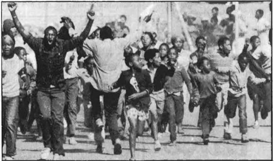
Protestes i enfrontaments sense aturador.

«Ja no hi ha terme mitjà, la reforma és impossible i, davant a l'apartheid, només queda un camí: l'eliminació.» La frase, contundent, pertany al poeta afrikaner blanc Breyten Breytenbach, acusat de terrorisme i habitat durant més de vuit anys de les presons del govern de Pretòria. Però no només a ell. Perquè és una frase que avui pronunciaria ja cada habitant de raça negra de Sud-àfrica, quan veu, astorat, com el racisme ofega, com més va més, un país que és ja en la frontera de la guerra civil.