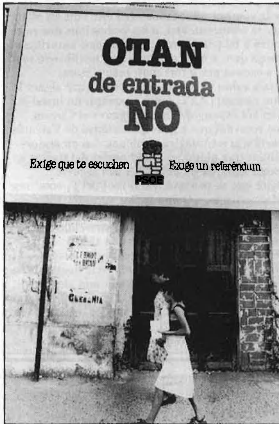
A l'esquerra, Reagan, president del país que ha jugat més fort en tota la qüestió. Dalt, consigna del PSOE en 1981.

per oposar-se a l'ingrés) i si Espanya se'n surt ara, els conservadors la hi tornarien a ficar quan obtinguessin el govern. Aquestes entrades i sortides de l'OTAN crearien, òbviament, fortes tensions internacionals i malmetrien greument la imatge exterior d'Espanya, donant-li un caire d'instabilitat i d'imaduresa. La idea que es treballà des de la Moncloa al llarg de 1983 i 1984 fou que la inserció espanyola en les estructures occidentals, després de l'aïllament imposat per la dictadura franquista, ha d'abastar tots els terrenys. No sola-