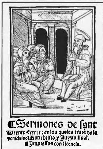
Els sermons de Sant Vicent, víctimes de l'espoli.

Ara s'ha fet públic que alguns dels funcionaris encarregats en les últimes dècades n'havien detectat les absències. De 1940 ençà, pareix que ha estat una constant. L'Ajuntament ha decidit fer una denúncia en tota la regla, i el cas ha passat a ser objecte d'investigació policial. ¿Quan i com s'ha produït aquest atemptat cultural? ¿Qui n'és el responsable? La investigació ho haurà d'esbrinar. En tot cas, però, ens trobem davant un exemple de l'abandonament en què ha viscut el patrimoni cultural comú. Constatar-ho