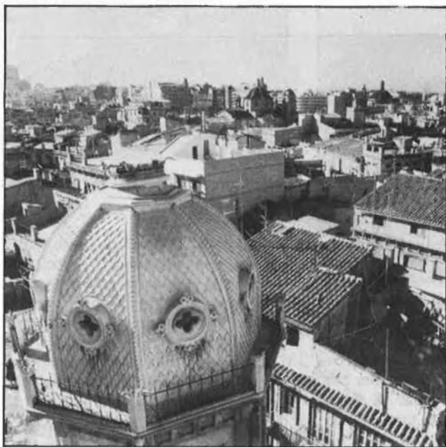
València busca una conformació urbana més definitiva.

Es tracta, indubtablement, d'un esdeveniment fonamental, no sols perquè afecta la concentració urbana més important del País Valencià, sinó perquè constitueix una acció de planificació urbanística —la més global que un consistori pot dissenyar— sobre una ciutat amb la pell