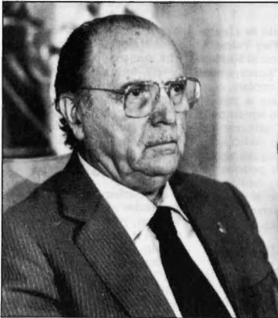
UN FET DESTACAT EN LES ELECCIONS GALLEGUES