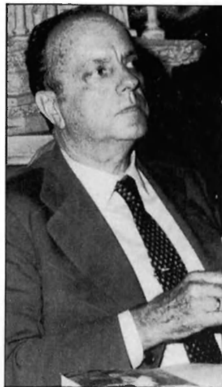
Fraga, sense majoria absoluta.

nia com a pilars allò de «fem-nos escoltar, fem-nos respectar», o sia, Galícia per als gallescs i no per a partits i grups aliens a la seva realitat. Una anècdota que pot resumir la campanya de CG es va produir al míting final. El conjunt musical que actuava va deixar estorats els «coagas» en improvisar un discurs per a donar les gràcies a CG perquè era l'únic partit que havia contractat un grup galleg per a la seva festa i, que a més, els pagaven.