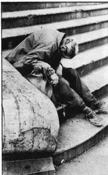
Encara es pot morir de fred al carrer.

cials, com antigament es feia, han tornat a oferir un plat de sopa als mendicants de la ciutat, com també algun entrepà. La Generalitat disposa de tres menjadors, que depenen de la Direcció General de Serveis Socials, aquests estan situats: al carrer de Canuda, al Paral·lel i al carrer del Municipi del Clot.