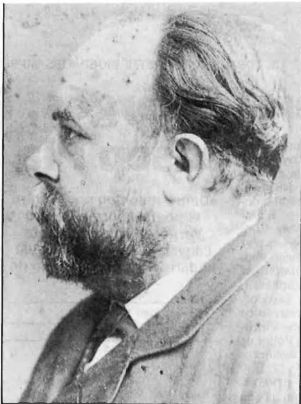
Dalt, Teodor Llorente en l'època de plenitud. Baix, d'esquerra a dreta, Medalló commemoratiu de Lo Rat-Penat per la publicació de Lo Llibret de Versos en l'any de la publicació. Primera pàgina de l'exemplar de Canigó que Jacint Verdaguer regalà a Teodor Llorente. Damunt la dedicatòria, la creueta que mossén Cinto construí a Palestina per a Llorente. Carpeta que incloïa el manuscrit original de Canigó regalada per l'autor a Llorente. El manuscrit fou robat.

Llorente, retirat dels quefers periodístics, acabà els seus dies entre l'Hort de Museros i la propietat de Natzaret amb la tranquil·litat del jubilat i la joia d'haver estat allò que havia volgut ser.