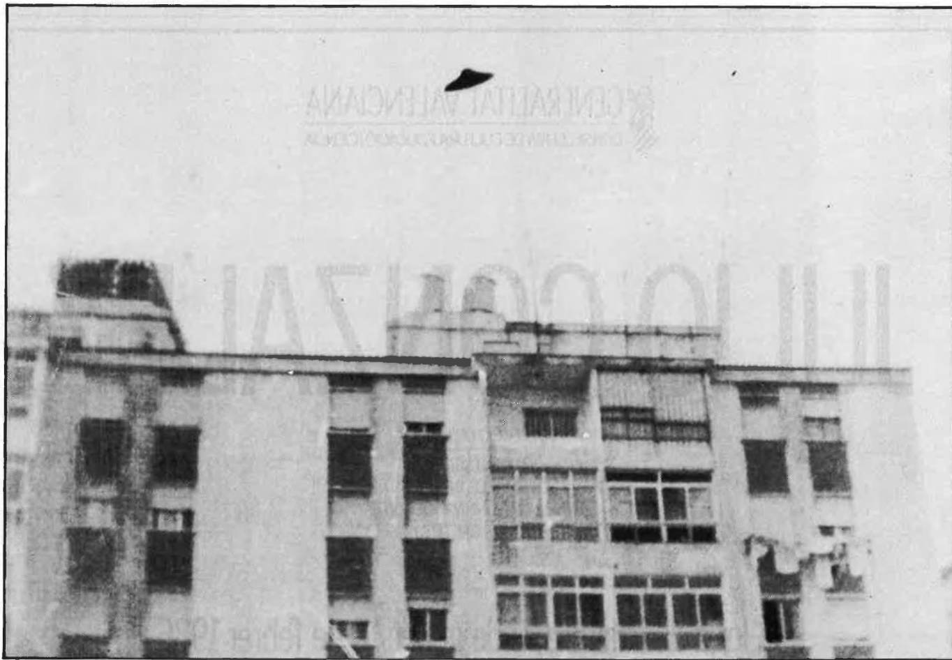
Imatge d'un objecte volador captada per uns afeccionats amb una càmera pocket.

El problema, tanmateix, ha mogut centenars de discussions, polèmiques inacabables. ¿Són tots els ovnis objectes tripulats? ¿Qui els tripula? ¿Són aeronaus secretes de potències terrestres? ¿Es tracta d'objectes tripulats per sers d'altres planetes o galàxies? ¿Poden ser habitants del nostre futur, viatjants a través del temps? Dos mil casos, difícils d'explicar, s'han produït en les dues darreres dècades a la península ibèrica, un bon grapat dels quals ha tingut per escenari València i els seus voltants. Des de 1945 sembla que més de tres-cents Objectes Voladors No Identificats han estat albirats sobre el País Valencià. A Vinaròs i al Saler, al Montdúver o a Xest, a Sumacàrcer i a Vilamarxant... casos que mai no