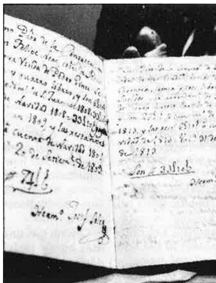
Una «llibreta» de pagaments, l'única prova de l'antiguitat dels contractes.

d'aquests arrendataris. Tot i que, tant els mateixos llauradors implicats, com els polítics i els juristes consultats, coincideixen en el fet que es tracta d'un problema de difícil solució, l'elaboració d'aquesta llei d'abast autonòmic apareix com l'única alternativa possible a un conflicte social d'imprevisibles conseqüències, que esclataria en el moment en què les expulsions d'arrendataris començaren a fer-se efectives. Al voltant de deu mil famílies viuen actualment, al País Valencià, treballant una terra de la qual no són propietàries, en règim d'arrendament històric —des d'anys «immemorials», que diu el costum, basat en els antics Furs, els quals dotaven