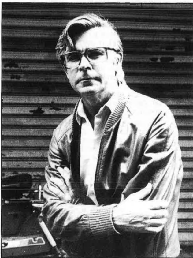
«València era una mena de convent avorrit».

«La prova d'ingrés consistia a redactar una memòria i a fer un examen de cultura general. Davant la nostra sorpresa —n'érem un doll, els candidats— tots dos vam ser admesos en l'Escola. Ja posats, en acabar la meua etapa miliciana, vaig tornar a Madrid per tal d'estudiar una carrera que fins aquells moments no m'havia passat