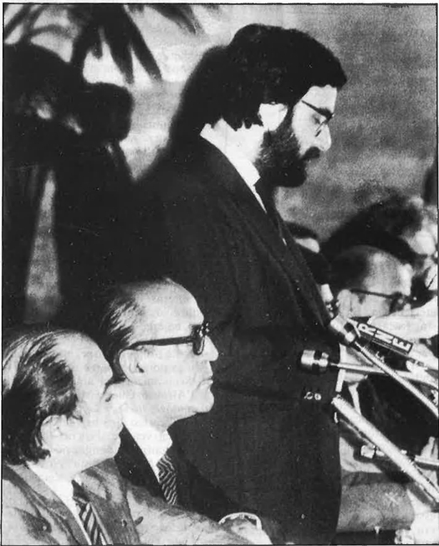
Serra té, al darrere, la seua gestió com a alcalde de Barcelona, però també, com a contrapés, la realitzada com a ministre.