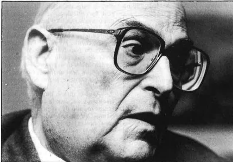
«Han presentat Felipe com presentaven Franco».

l'almoïna d'una majoria hegemònica. I això ens va obligar a conviure, a transigir, a comprometre, perquè ningú no va tenir la temptació de dir els meus vots són aquests, i fora.