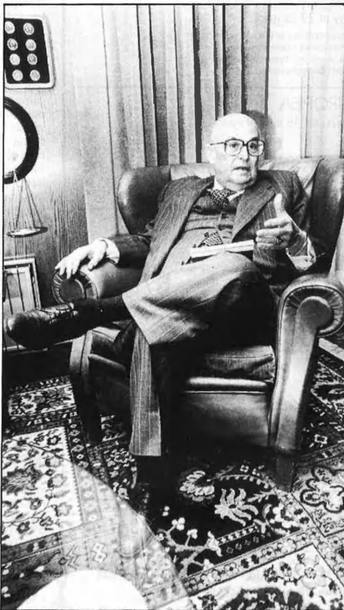
«Un dels grans fracassos de la Constitució és el Senat».

com a cambra de representació territorial, que és una frustració. Anomenar representació territorial quatre senadors provincials i un altre per cooperació... Des que es va fer això, es va frustrar el Senat. Crec que a través del reglament, i a través de la llei electoral, en definitiva, s'imposarà la reforma constitucional. Si es manté el Senat, haurà de ser amb un contingut autònom.