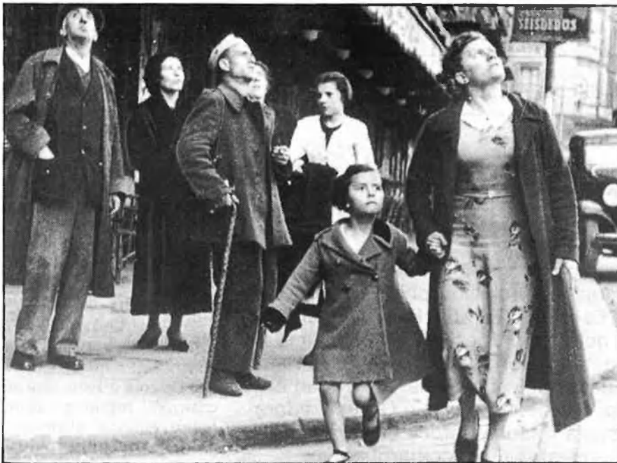
El 18 de juliol: ocàs de familiars, hisendes, amors i drets.