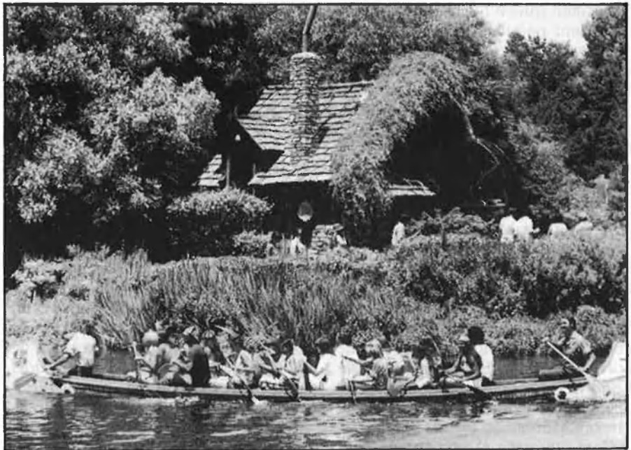
LA LLUITA PEL CONTROL DE L'IMPERI DISNEY

L'impacte ecològic de la urbanització de més de 7.300 hectàrees del litoral, damunt de les quals hauria de passar una massa humana de sis milions i mig de visitants a l'any, pot ser molt greu i pot implicar un nou retrocés de la vida natural al nostre territori. Ecòlegs i ecologistes haurien de pronunciar-se en aquest tema, i qualsevol decisió hauria de considerar també aquesta variable. □