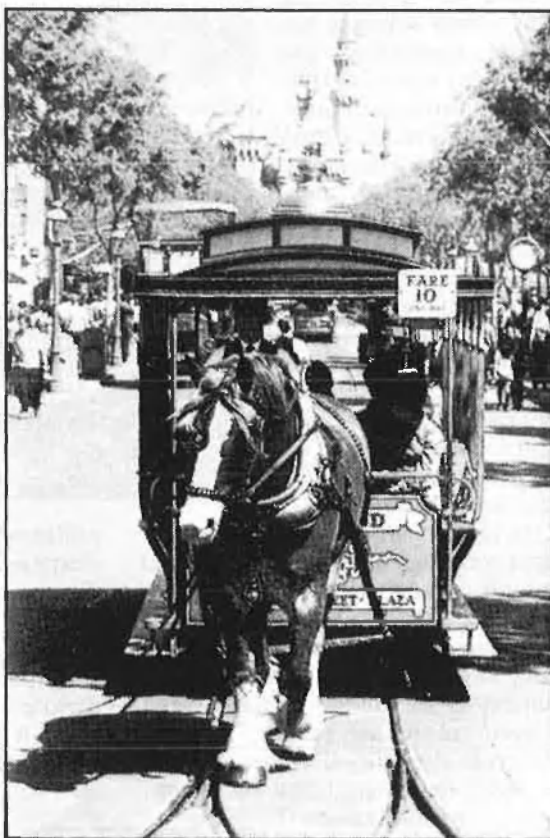
Pàgs. 7 i 8: «Meravelles» Disney.

Això ens porta al terreny dels efectes externs del parc. Els positius resulten discutibles: l'empresa voldrà rendibilitzar al màxim la inversió i, per tant, oferirà als visitants un con-