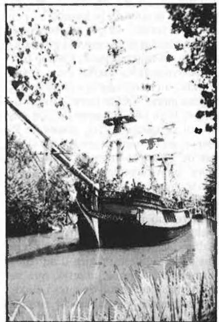
Des de Wall Street es miren, cobejosos, la Disney.

La companyia, amb seu als Estats Units, es veié amenaçada per la competència d'altres firmes cinematogràfiques, productores de televisió i pels rapinyadors dels negocis mundials. Així com moltes cases editorials europees han anat passant a mans de fabricants de sosa càustica, d'herbicides, de canons, de plàstics o del que sigui de tot allò que no té res a veure amb les lletres, d'una manera semblant, quasi totes les grans i clàssiques productores de Hollywood han anat passant a ser propietat de multinacionals alienes al cinema. Quan sa-