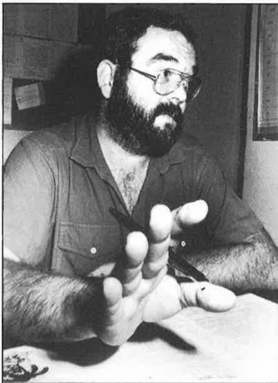
«Una acusació contra el moviment ciutadà».