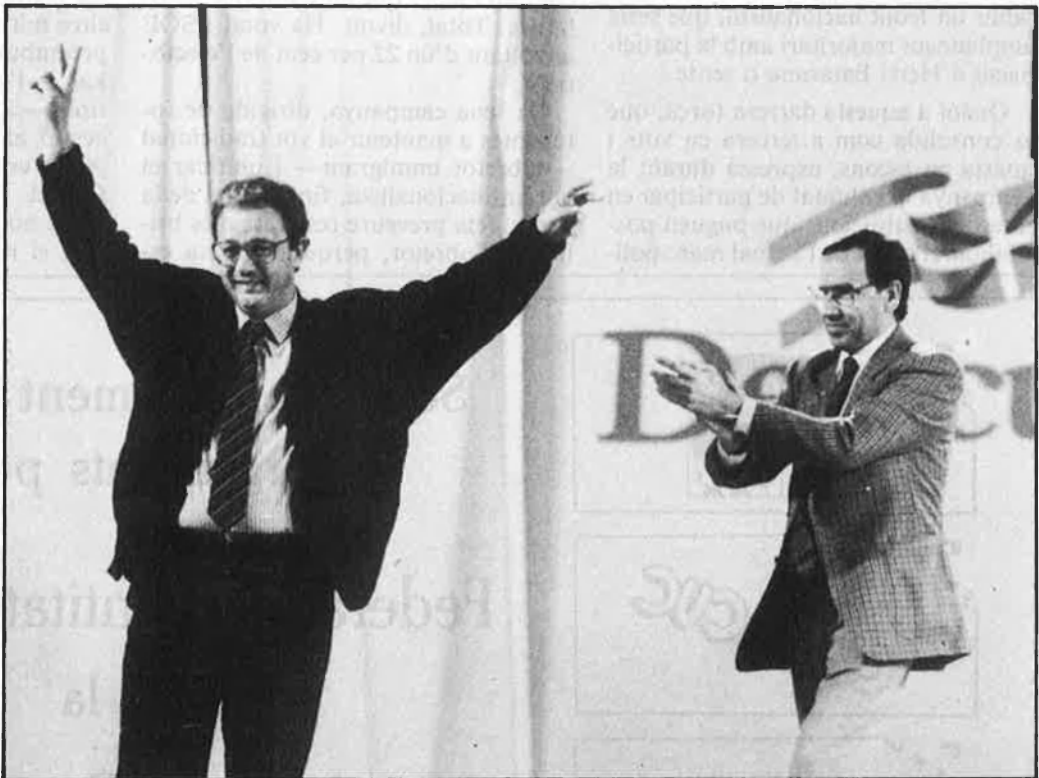
Calia guanyar, encara que amb uns resultats que només serveixen simbòlicament.

Pel que fa al PNB, amb 17 parlamentaris, es passà la campanya insistent que, si no és el partit guanyador, passaria a l'oposició. Segons després de conèixer-ne el resultat, la cosa es posa molt més peluda que no es pensaven: d'una banda, són el partit més