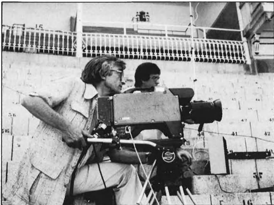
Una referència constant: la reivindicació del veure televisió basca.

La mateixa vesprada en què parlàvem, el Parlament Foral de Navarra debatia la Llei de l'Èuscar, una llei contra la qual s'havien manifestat, el cap de setmana anterior, desenes de milers de persones. El seu contingut, com deien els pares de la ikastola Paz de Ziganda, és també tendent a reduir i aïllar al màxim l'ús normal del basc: en una Navarra dividida en tres zones, segons els percentatges més pessimistes de bascoparlants, aquests tindran dret, segons en quina estiguen, a ser contestats per l'administració en èuscar —si a l'administració li ve de gust—, a ser escoltats en èuscar —si a l'administració li ve de gust— i a ser escriuats en castellà —si és que els ha vingut de gust adreçar-se a l'administració en basc. Tot plegat, malgrat la distància, ens és familiar. □