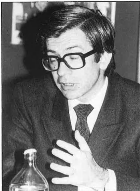
«El PDP no és de dretes ni de centre-dreta».