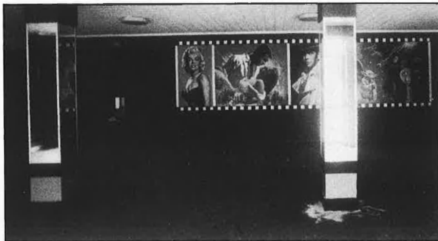
Dalt, interior del Triunfo. Baix, el Merp, ara.

¿Què se n'ha fet? Costa de pensar que on ara hi ha una formalíssima sucursal bancària abans suspiraren generacions veient la fascinació simètrica de