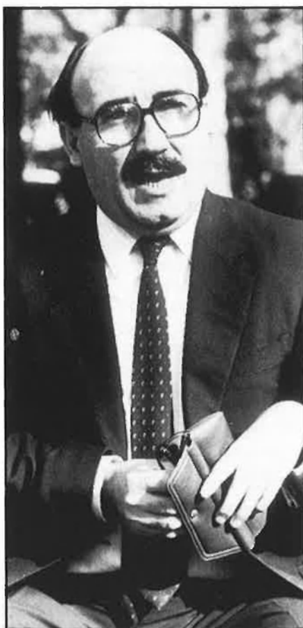
«La meua decisió és encertada».