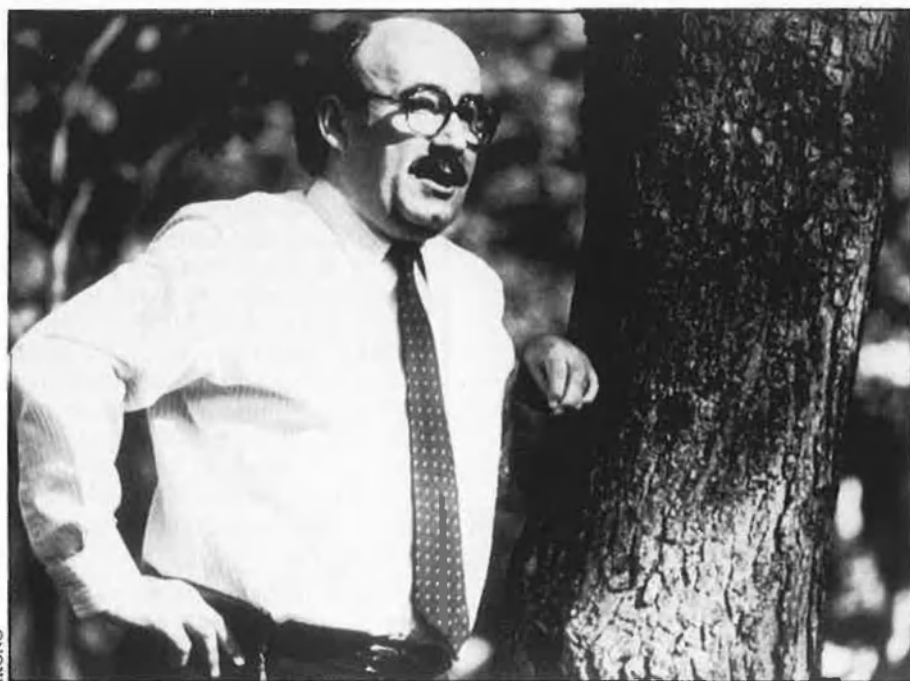
«IU no és més que un instrument en mans de Gerardo Iglesias».

—La falta d'equipament que pateixen moltes barriades. En molts casos, la resolució d'aquest problema ha vin-