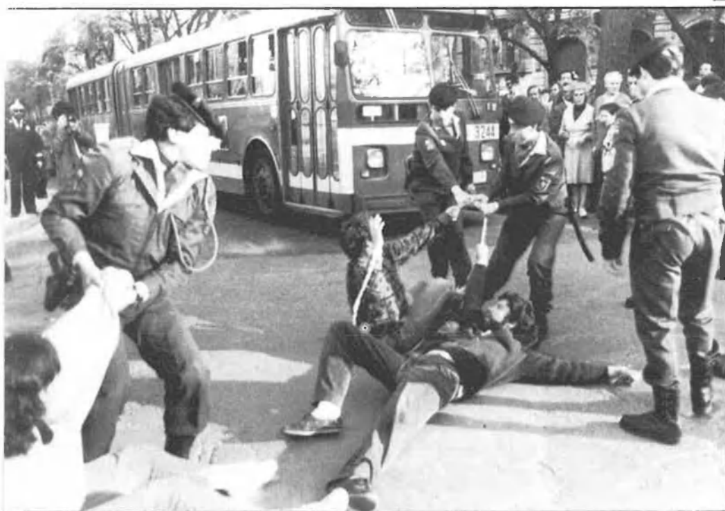
«L'acció contra El Corte Inglés, la més important per la seva espectacularitat.»