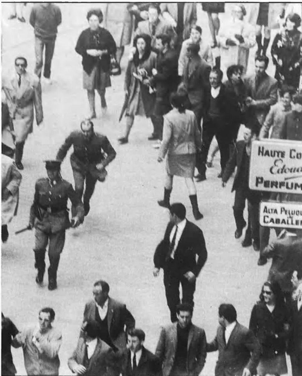
Fitxes policials de tres dels detinguts.

taris i la solidaritat amb els obrers biscaïns, que en aquells moments vivien en estat d'excepció.