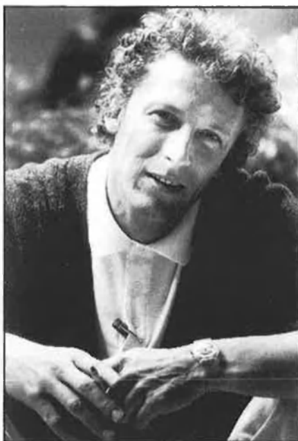
«M'agradaria que es traduís al català, una llengua sense estat».

Centre Carles Salvador Moratín, 15, 6a. 46002-València