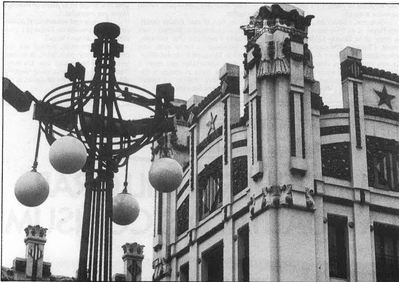
A l'esquerra, construcció del sostre de l'andana de l'estació. Dalt, imatge actual.

—Dona, en aquella època era impensable, una senyoreta com jo havia de saber idiomes, tocar el piano i tenir el batxiller ;i prou! Encara que jo he fet més que moltes de la meua edat. Quan em vaig casar, el meu home, que era enginyer, necessitava algú que dirigirà la comptabilitat de la seua oficina de contractacions i vaig posar-m'hi. I jo, que tenia inquietuds musicals i artístiques, vaig fer de comptable vint anys. Ara sí que faig el que m'agrada, perquè, des de fa uns anys, treballo a l'estudi de ceràmica de la meua filla. No tinc cap obligació i, ja veus, als meus anys ( en té vuitanta-un ), però, és que m'encanta, m'ho passe bomba. Treballem la ceràmica a mà i fonamentalment imitem la del segle XVIII. Jo m'encarregue de buscar-ne els models