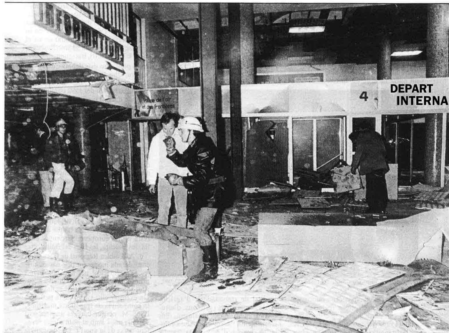
Dalt, bomba en l'aeroport d'Ajaccio. Baix, caricatura de Còrsega, a la premsa francesa.