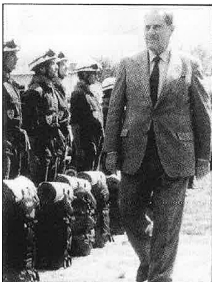
Charles Pasqua visitant Còrsega al juny d'enguany.

Per als quasi un milió de turistes que visiten Còrsega cada estiu, aquesta illa mediterrània no és més que un lloc ideal per a passar-hi unes vacances, un indret on costa i muntanya es fonen en un paisatge extraordinari.