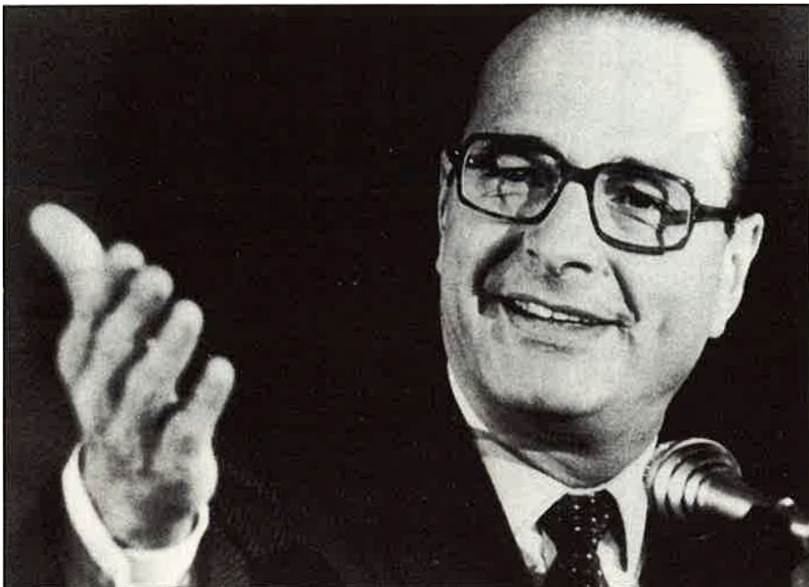
El govern de Jacques Chirac ha vist com se li tallava la treua concedida al gabinet socialista.

La mateixa existència de dos departaments a l'illa, amb dos Consells Generals que tenen tantes o més competències que el govern autònom, fan del tot ineficaç l'Assemblea, que encara discuteix —cinc anys després de les primeres eleccions— quina ha de ser-ne la seu definitiva. Aquest sembla el tema més debatut pels corsos, vistes les planes que hi dediquen els dos diaris locals: Nice-Matin i Le Provençal , tots dos editats al continent i de clara tendència pro-francesa. Els nacionalistes proposen que l'Assemblea s'allotgi en un antic hotel de Corti, al centre de l'illa, mentre que la majoria de dretes vol continuar a Ajaccio, al sud i per tant, allunyada de tot el nord, molt més poblat. Ajaccio és, a més, la ciutat imperial de Napoleó Bonaparte, l'única de tot l'Estat francès que té encara un partit bonapartista amb força seguidors.