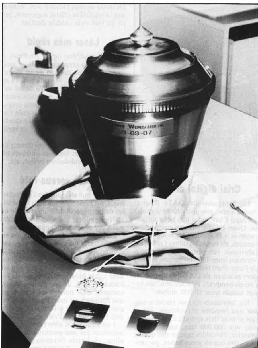
Quilo i mig de cendres, dins una coctelera.

treballem diàriament, la temperatura es manté. El cadàver crema amb el fèrretre. Si el got del taüt és de zinc, li'l lleven. La incineració sol durar entre seixanta i noranta minuts. L'home sol trigar un poc més a cremar que la dona, que té més greix. Un quart d'hora més».