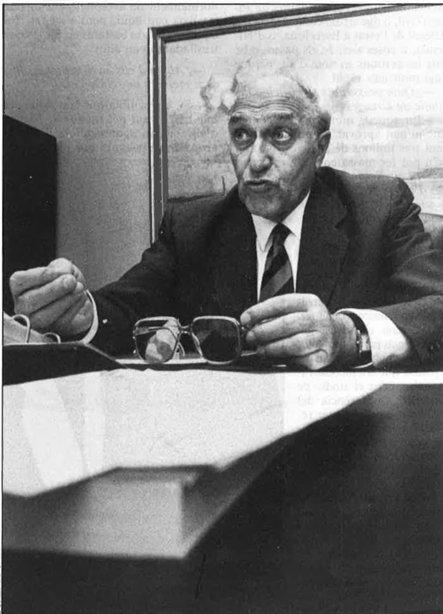
«La Llei Antiterrorista va suposar una discrepància amb el defensor del pueblo».