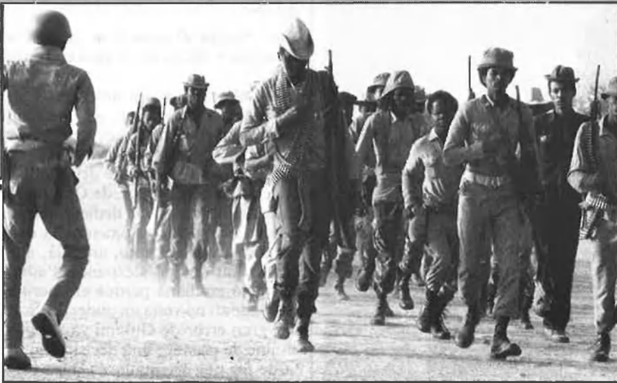
Combatents del FAD, amb armament fabricat a l'Estat espanyol.

ANL: Exèrcit Nacional d'Alliberament, que són les mateixes forces reagrupades del GUNT que lluiten contra Habré, al nord del Txad. Bàsicament, l'ANL és el mateix que les FAP, junt amb el CDR i alguns homes d'altres faccions. □