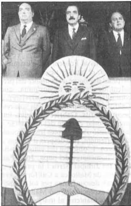
El president Alfonsín amb Jordi Pujol.