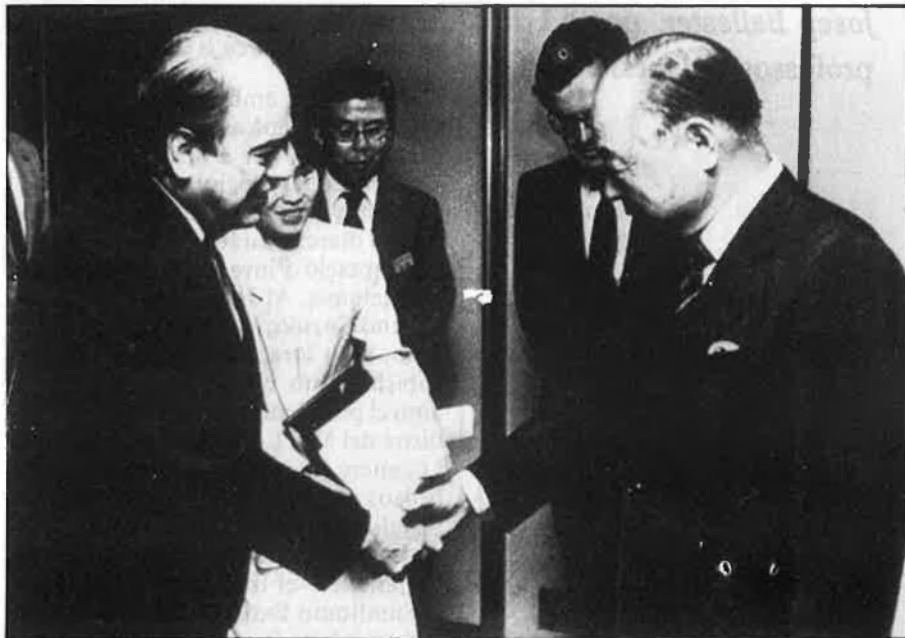
Viatge del president Pujol a Tòquio.