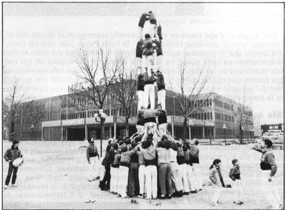
Visita del president de la Generalitat de Catalunya a Essen, amb xiquets inclosos.

L'any 1986 començà amb un viatge a París, al gener, per fer una conferència a la Universitat de la Sorbona, sobre la identitat cultural de Catalunya. Al febrer, a Davos, per participar en el simposi internacional d'aquesta ciutat, organitzat per l'Economic Management Forum. I, al març, a Essen,