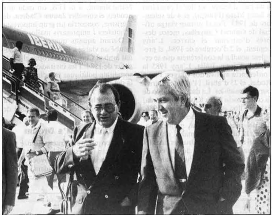
El president Carrià, a l'aeroport de Palma, a la tornada de Califòrnia.

Sanyo té projectat un centre d'investigació a Sant Cugat, que representarà una inversió d'uns 3.000 milions de pessetes. Panasonic també realitzarà una important inversió en la fàbrica que ja disposa a Girona i elaborarà components electrònics que seran utilitzats per les altres factories de la mateixa empresa repartides per Europa.