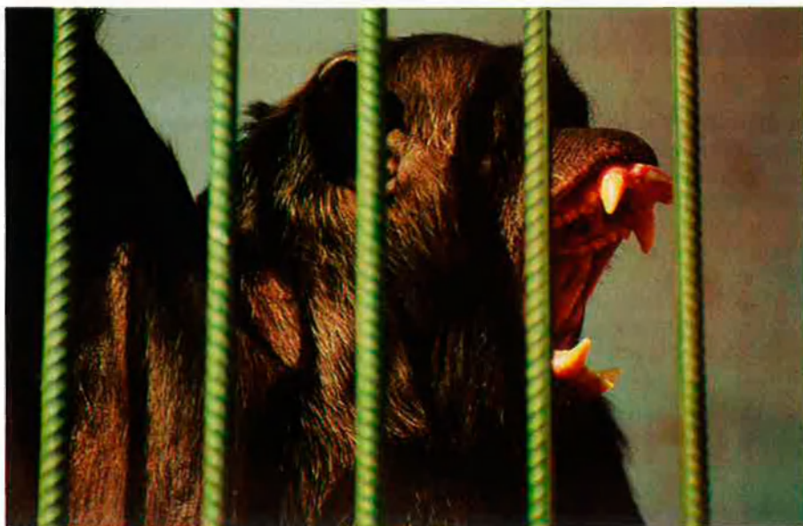
El «parc» d'animals de companyia ja no es redueix a gossos gats i periquitos.