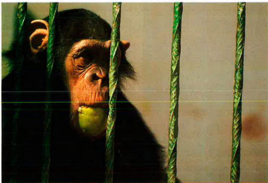
Els ximpanzès sovint són utilitzats com a reclam publicitari pels fotògrafs.