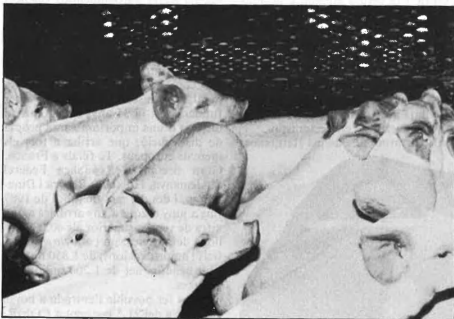
L'existència de la pesta porcina impedeix tota mena d'exportacions a la CEE.

* Diputat per Lleida del grup Minoria Catalana.