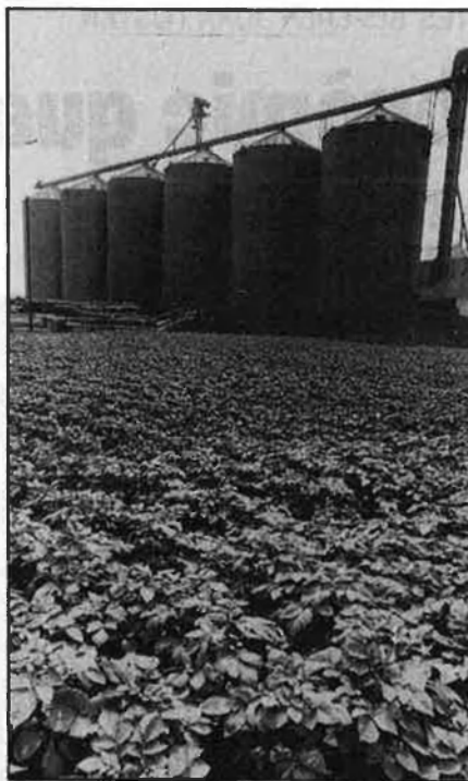
L'agricultura, tots hi parlen d'esquena.

Però les contradiccions arriben més enllà. Els catastrofistes asseguren que l'empresariat valencià no s'ha esforçat prou i obliden sectors tan importants com l'alimentari o el de la distribució comercial, que, segons sembla, no entren en els estudis dels «economistes moderns», almenys pel que fa a les es-