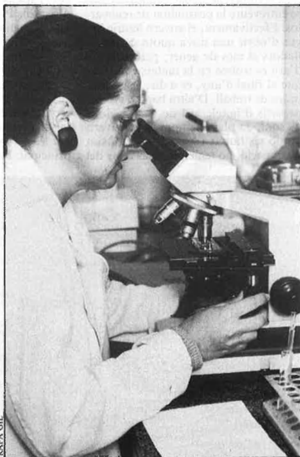
Sala d'investigació de l'Hospital General.

—A hores d'ara són vora cent dones les que han pres la píndola abortiva. ¿Quantes d'aquestes dones han avortat?