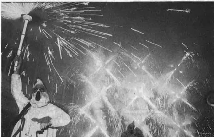
La nit, gràcies al grup Xarxa, es torna màgica a Vila-real.

Q ui vol un miracler? Doncs bé, el miracler està servit. Dotze grups de teatre de carrer han acudit a la convocatòria del I Festival de Teatre de Carrer que se celebra durant aquests dies