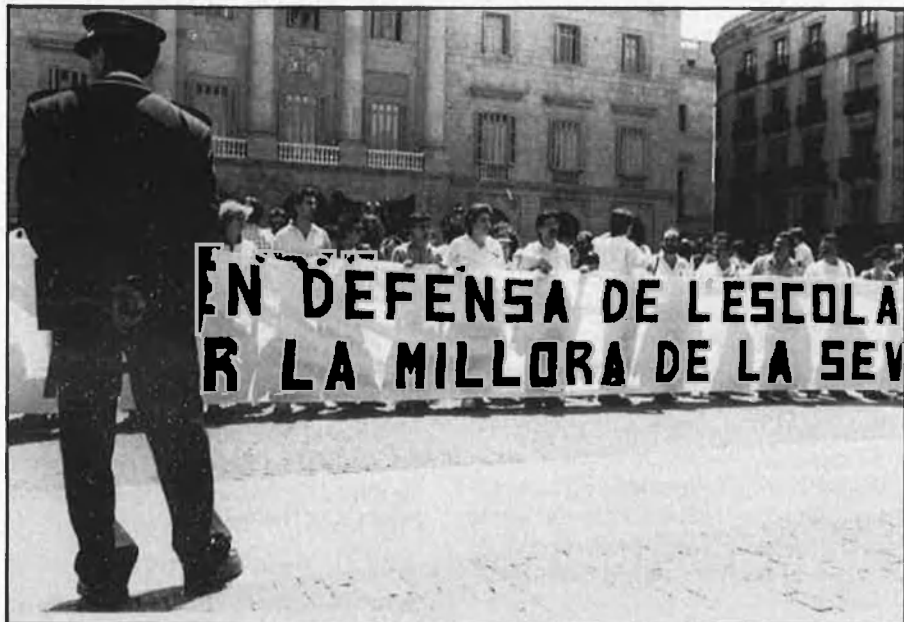
S'ha guanyat una batalla, però ningú ha guanyat la guerra.

d'augment salarial de l'administració, «ja que resulta ridícula i enganyosa». Per a aquests sindicats, l'homologació per la qual lluiten significa l'equiparació retributiva amb la resta dels funcionaris de l'administració pública, i no s'entén sinó dins del marc de la dignificació professional que junt amb unes millors condicions de treball, suposen un avanç en la qualitat de l'ensenyament.