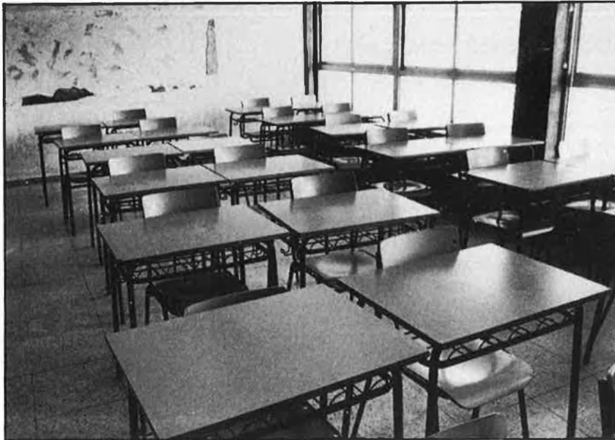
Si no s'arriba a un acord amb la Conselleria després del 20 de juny, s'ajornarà el conflicte fins el pròxim curs.

de l'import que es fixe, l'1 de juny de 1990 en un 66 per cent, i l'1 de setembre del mateix any en un 100 per cent». L'efectivitat d'aquest acord queda supeditada a l'aconseguit de la normalitat acadèmica i escolar, cosa que, segons la conselleria, no s'ha produït, ja que es resisteix a firmar.