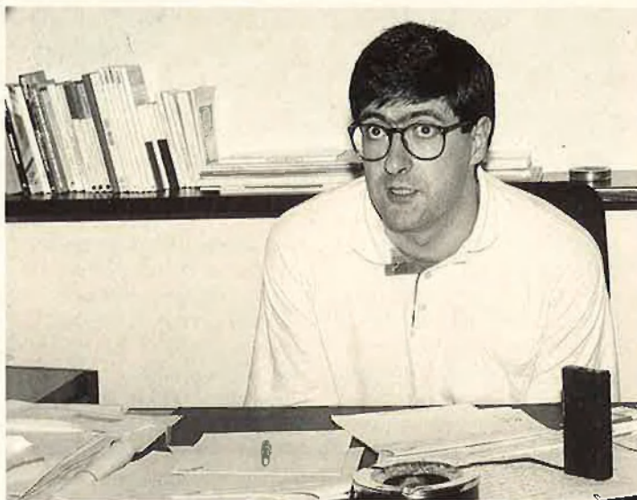
«El nacionalisme com a idea totalitzadora ha fracassat».

—Reconec que la realització d'aquest congrés ha sigut en un moment molt adequat per al partit però també és cert que amb aquesta iniciativa hem assumit un repte per al futur. Quan plantejarem el congrés amb les portes obertes, ningú es va fer enrere