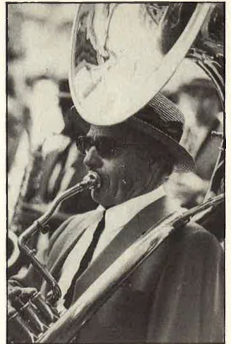
Amb la música a València.