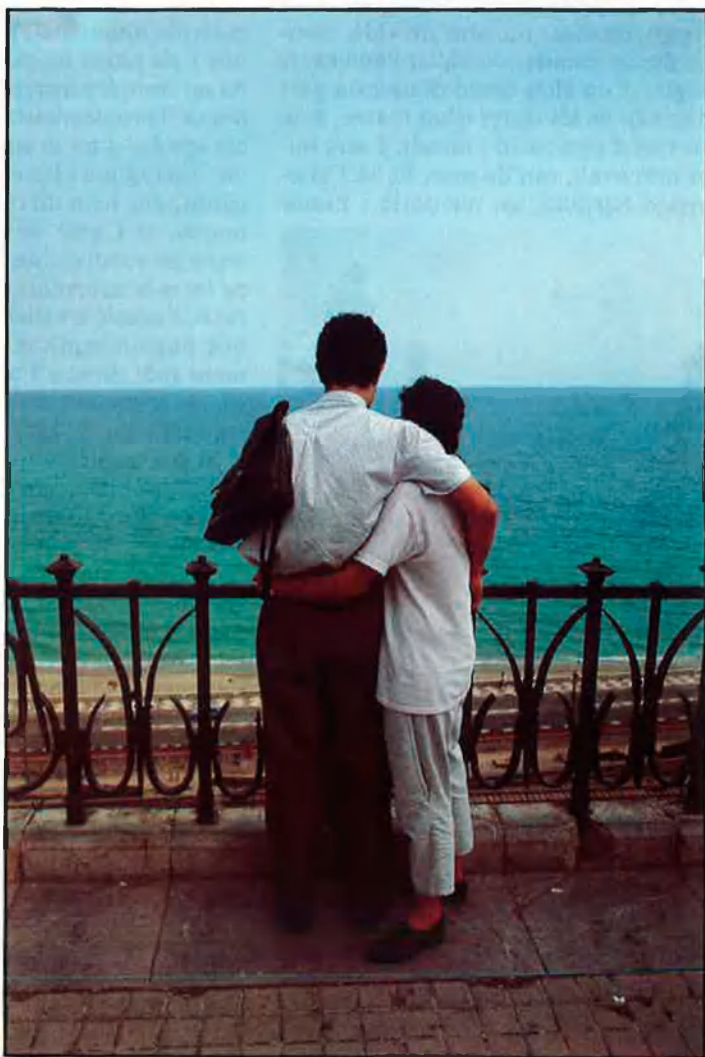
Tarragona, obra dels Escipions, segons la «Història Natural» de Plini el Vell.

Text: Jaume Vidal i Ramon Renau.