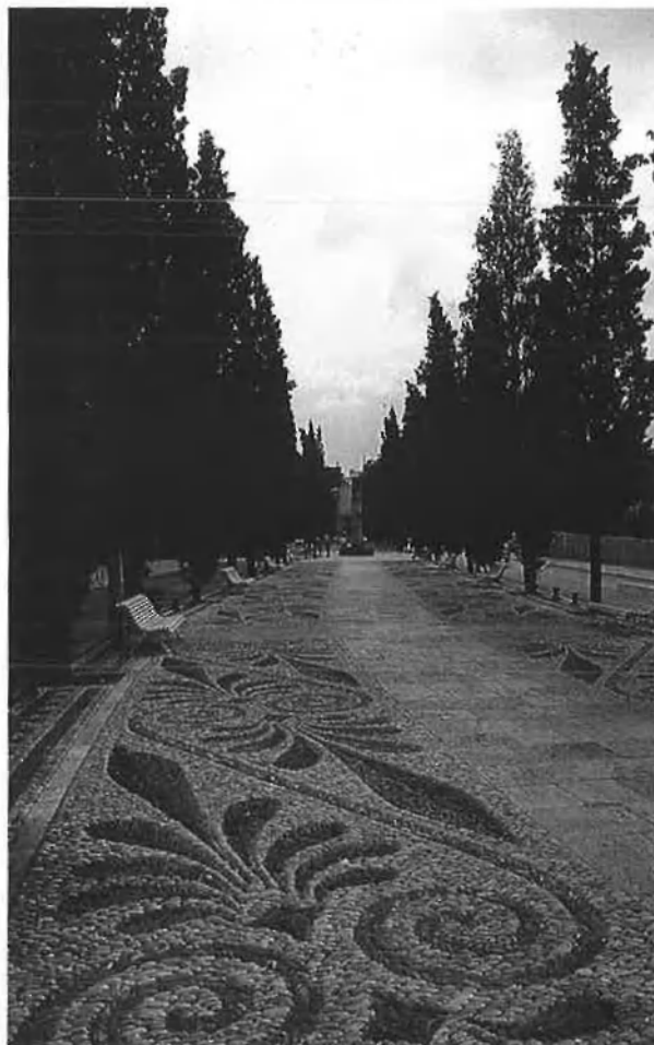
L'amfiteatre, una de les mostres romanes més representatives de la ciutat.

Si ens haguéssim de refiar de la iniciativa pública, l'hivern tarragoní seria ben dur i avorrit. Des de la Festa Major de setembre fins a Sant Joan, només l'ajuntament, entre les nombroses entitats oficials que han proporcionat a la ciutat fama d'oficialosa i estàtica, organitza els actes del carnaval. Les nits d'hivern dels que no es queden a casa davant del televisor i el vídeo transcorren als bars, que com que continuen oberts a l'estiu, ja us els podeu apuntar. Després del desaparegut i mític La Geganta, el nucli antic va ser la primera zona que va notar l'impuls creatiu d'uns anys enrere que va proporcionar a Tarragona bars de nit, o pubs , amb música i un concepte diferent de l'espai, que sovint acull exposicions o actes de la mena més diversa. Entre tots, el primer, que ara celebra el desè aniversari amb una sèrie d'exposicions dels artistes més destacats de la comarca, és Poetes, cafè artístic, molt a la vora de la catedral. A poca distància, entre d'altres, El Tall (Saïda), que a més de bona música de jazz ha incorporat jocs, des dels escacs