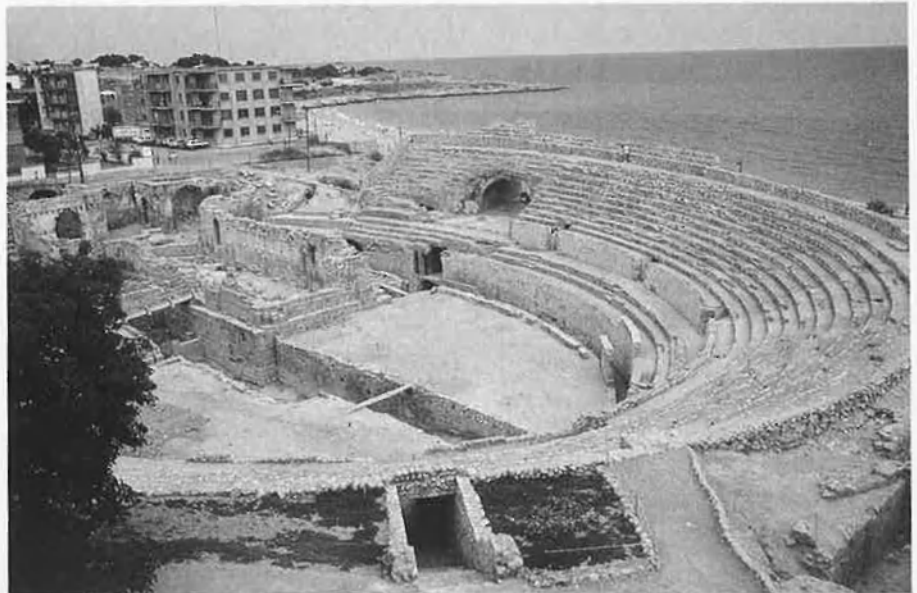
La vella Tarraco esdevé «imperial» amb l'estada d'August.

I, per acabar, que és per on comença la majoria, les platges. A Cambrils i Salou no goseu dur tovalloles de més