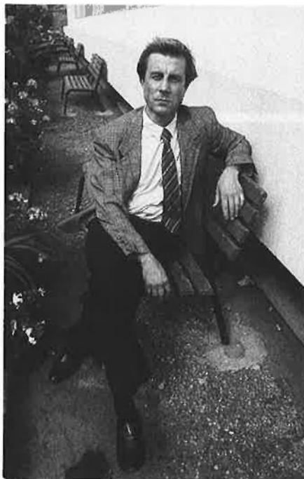
«No sóc un messies, tan sols un senzill 'contacte'».

—Quan aquesta llum visible demostra un comportament intel·ligent. No quan la trajectòria que duen és uniforme, recta i lenta, com és el cas dels satèl·lits artificials, avions o helicòpters, sinó quan les evolucions són erràtiques