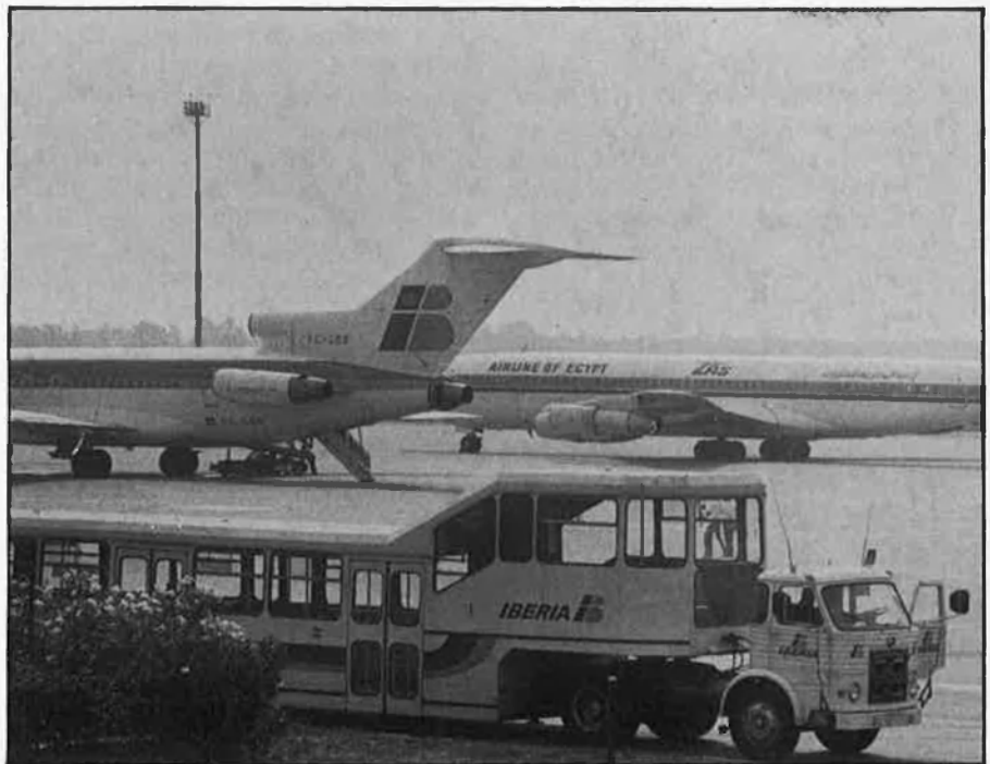
Aeroport de Palma: el segon de l'estat.

ren 5.619.700 passatgers dels quals un 78% eren estrangers. El trànsit aeri i el moviment de passatgers d'11,3 milions el situa en segon lloc dins l'estat, després de Madrid, però en trànsit internacional se situa a la capdavantera i a la resta d'Europa en vuitè lloc, segons el trànsit total de passatgers. El