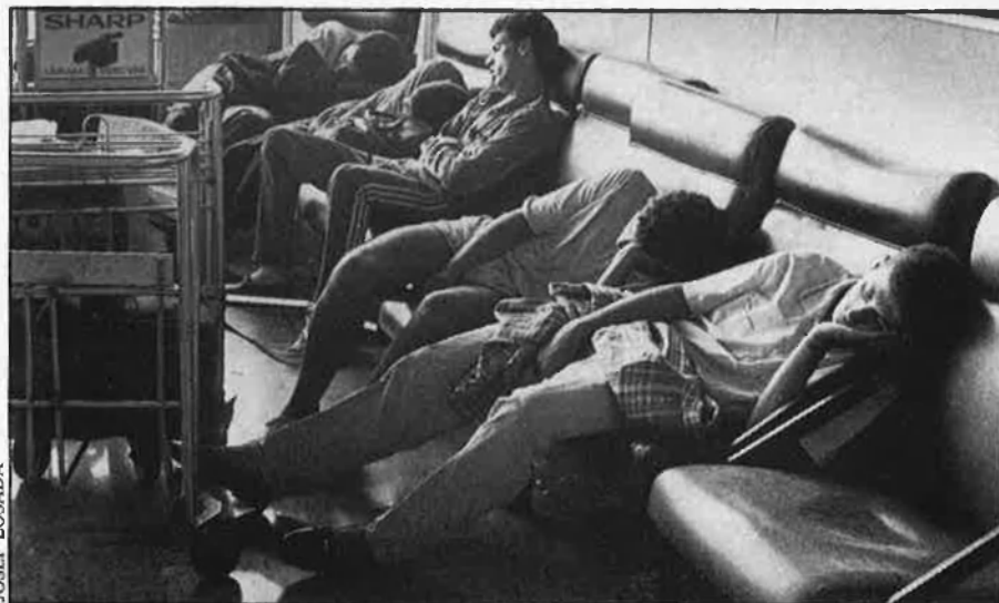
Els retards, un risc per al sector turístic.