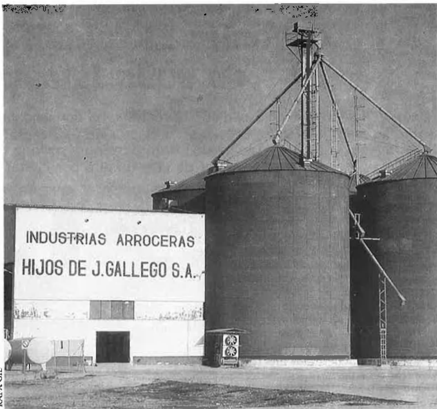
La CEE importa a l'any 130.000 tones d'arròs elaborat, però el volum amb què trafica és deu vegades superior.

Fa dos anys, amb la finalitat d'aconseguir una major competitivitat en el mercat, les cooperatives arrosseres de Sant Jaume d'Enveja, Amposta, La Cava, Jesús i Maria, Camarles i l'Aldea, van constituir la cooperativa de segon grau «Arrossaires del delta de l'Ebre», que agrupa els sis mil productors de les sis cooperatives. Experts de la zona consideren que si les zones andaluses, valencianes i del delta de