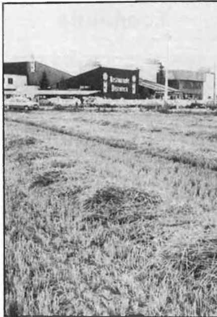
La varietat 'índica' creix en superfície.

Una subvenció tan elevada no ha provocat l'efecte esperat ja que no s'ha augmentat la superfície de cultiu de les varietats índiques. La CEE, per a reduir les seues importacions, hauria de dedicar 70.000 ha. a la producció d'aquestes varietats, xifra que de cap manera s'aconseguirà si tenim en compte el poc interès que tenen els agricultors sud-europeus a efectuar canvis.