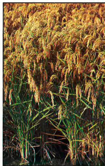
De cara a Europa, s'haurà de primar la varietat 'índica'.

En els últims anys s'han introduït les varietats de tipus llarg, de forma experimental, fonamentalment a les maresmes del Guadalquivir. La producció suposava sols el 5% de la superfície